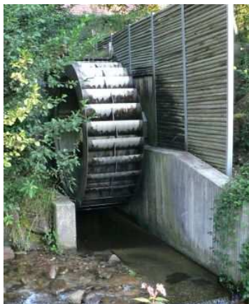
Malé spády lze využít pomocí vodního kola.